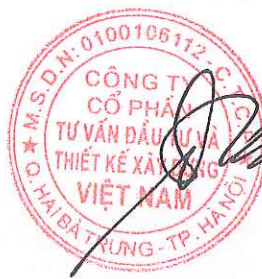
TRẦN BÌNH TRỌNG